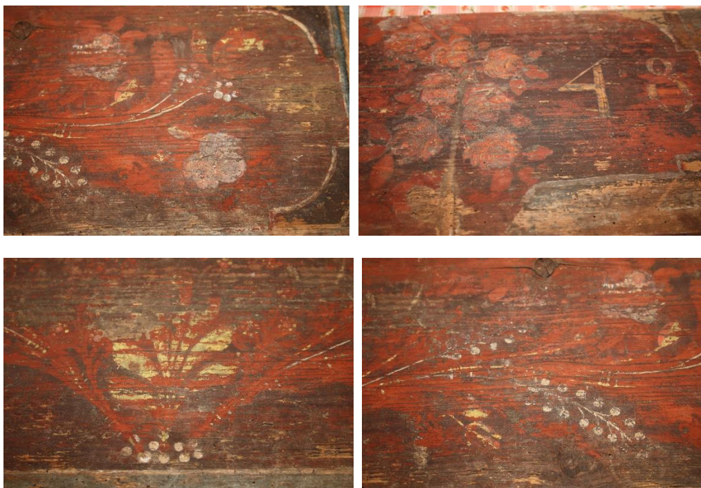
Agyagfalván gyűjtött festett munkák 1848-ból, A Malonyai és Kardalus által bemutatott agyagfalvi festett bútorokkal azonos jellemvonásokkal